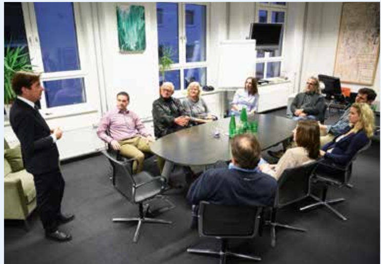
Alumni Visit: „Presse“-Chefredakteur Rainer Nowak gab Einblick in das Tageszeitungsgeschäft