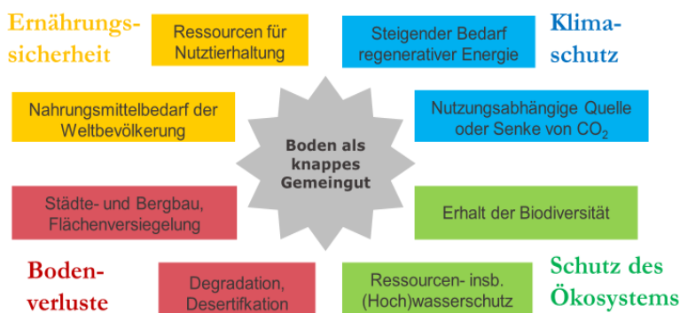
Abbildung 2: Vier Faktorengruppen tragen maßgeblich zur Verknappung von Boden bei. Viele dieser Faktoren gewinnen durch eine steigende Weltbevölkerung und zunehmende Ansprüche jedes Einzelnen an Gewicht. Seit jeher kommen ungerechte Verteilung und Verschwendung bzw. ineffiziente Nutzung hinzu. Nicht ausgewiesen sind finanzielle Einflüsse (wie flächengebundene Subventionszahlungen oder der zunehmende Landerwerb durch Investoren), die zwar nicht direkt für die Verknappung von Land, dafür aber umso mehr für die damit einhergehende Verteuerung der Flächennutzung verantwortlich sind.

der Bodenverluste im Rahmen einer nachhaltigen Landnutzung zusammenführen muss (Abb. 2).